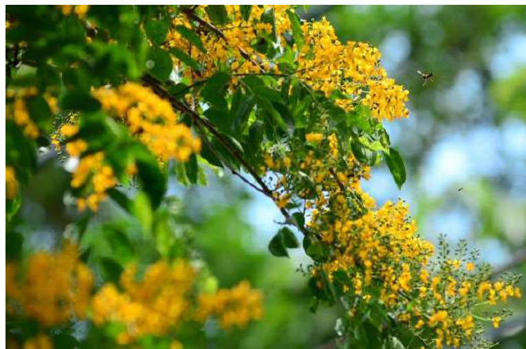
ภาพประกอบที่ 4 ต้นไม้ประจำมหาวิทยาลัย

ต้นไม้ประจำมหาวิทยาลัย คือ ต้นประดู่กิ่งอ่อน ที่ออกดอกชูชอบานสะพรั่งพร้อมกับบัณฑิตที่สำเร็จการศึกษา ซึ่งเปรียบเสมือนบัณฑิตที่มีคุณภาพและคุณธรรม พร้อมออกไปปรับใช้สังคม