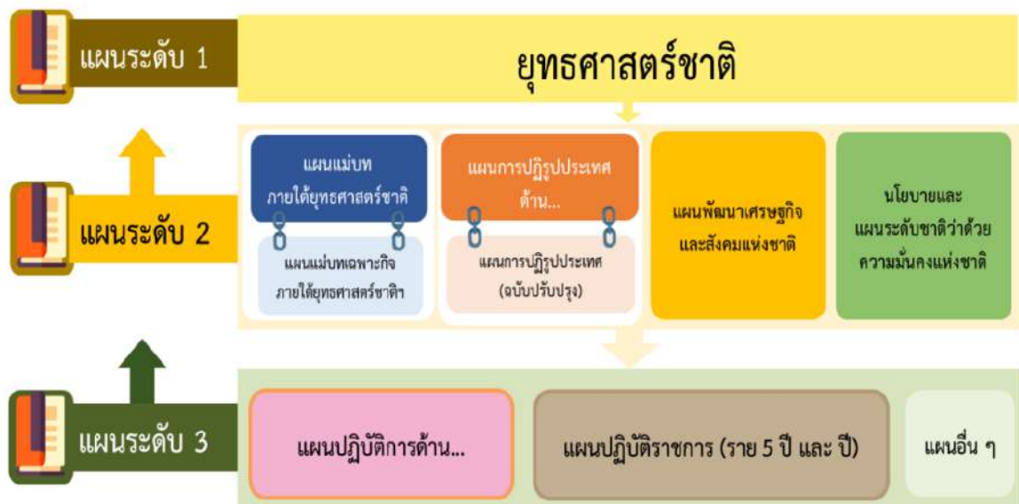
ภาพที่ 2.1 ความเชื่อมโยงของแผน 3 ระดับ

เริ่มตั้งแต่ประเทศไทยได้มีการประกาศใช้รัฐธรรมนูญแห่งราชอาณาจักรไทย พ.ศ. 2560 เป็นต้นมา รูปแบบการจัดทำแผนเพื่อวางกรอบทิศทางการพัฒนาประเทศได้มีการปรับเปลี่ยนไปอย่างมีนัยสำคัญ โดยมาตรา 65 ภายใต้หมวดแนวนโยบายแห่งรัฐ ได้กำหนดให้รัฐพึงจัดให้มียุทธศาสตร์ชาติ เป็นเป้าหมายการพัฒนาประเทศอย่างยั่งยืนตามหลักธรรมาภิบาลเพื่อใช้เป็นกรอบในการจัดทำแผนระดับ 2 และ 3 ตลอดจนการจัดทำกรอบงบประมาณรายจ่ายประจำปีให้สอดคล้องและบูรณาการกันเพื่อให้เกิดเป็นพลังผลักดันร่วมกันไปสู่การบรรลุเป้าหมายการพัฒนาประเทศที่กำหนดไว้ในยุทธศาสตร์ชาติ ทั้งนี้การถ่ายทอดยุทธศาสตร์ชาติไปสู่การปฏิบัติให้มีความสอดคล้องกันอย่างเป็นระบบนั้น ยุทธศาสตร์ชาติซึ่งเป็นแผนระดับที่ 1 จะทำหน้าที่เป็นกรอบทิศทางการพัฒนาประเทศในภาพใหญ่ที่ครอบคลุมการสร้างสมดุล ระหว่างการพัฒนาประเทศด้านความมั่นคง เศรษฐกิจ สังคมและสิ่งแวดล้อมเข้าด้วยกัน ด้วยกระบวนการมีส่วนร่วมจากทุกภาคส่วน (กองนโยบายและแผน มหาวิทยาลัยราชภัฏเลย, 2566 หน้า 15)